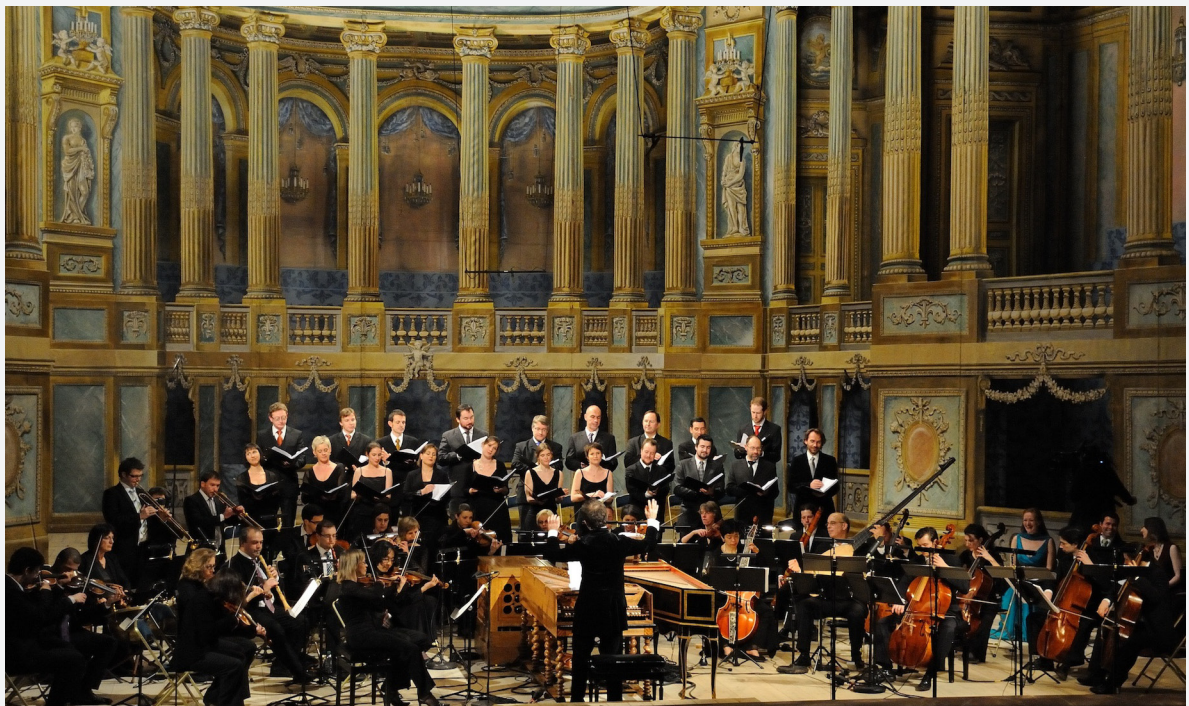
Belléophon à l'Opéra Royal de Versailles - décembre 2010