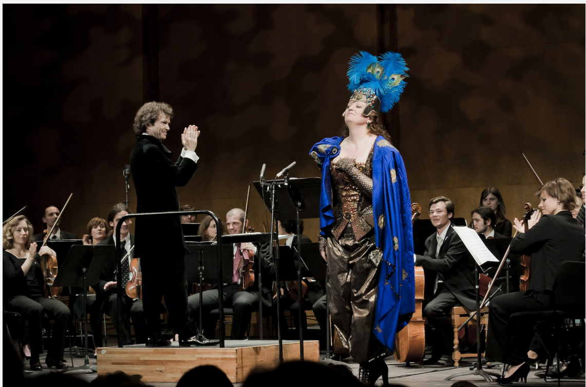
Farinelli - concert des 20 ans au Théâtre des Champs-Élysées - mai 2011

En 2010, le mécénat a représenté 10 % du budget global de l'association et a permis notamment la récréation mondiale de « Bellérophon » de Lully (Choc de Classica, Diapason Découverte, ffff de Télérama, Le Diamant d'Opéra Magazine...).